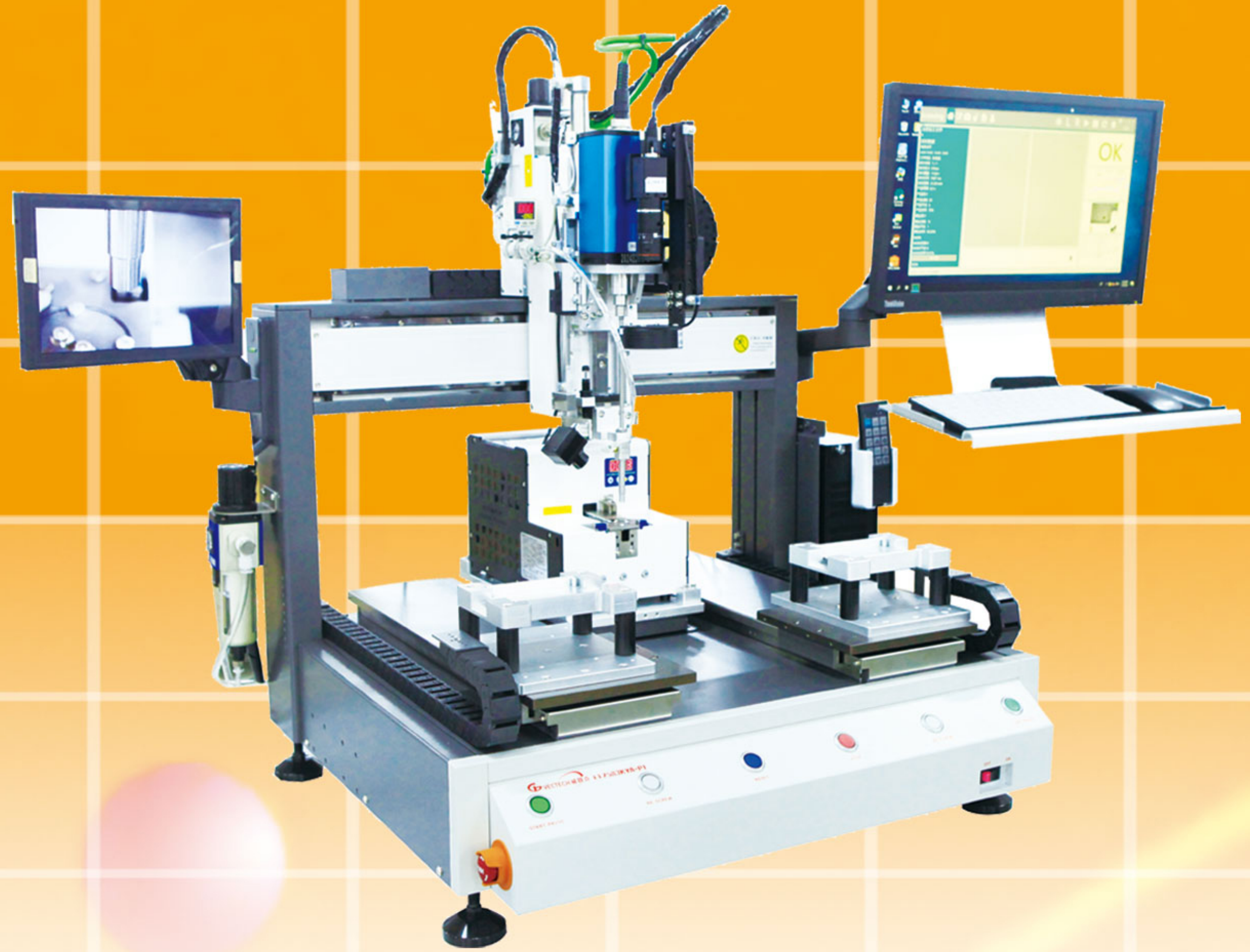
ET-7583KYA-P1(雙 Y 軸)