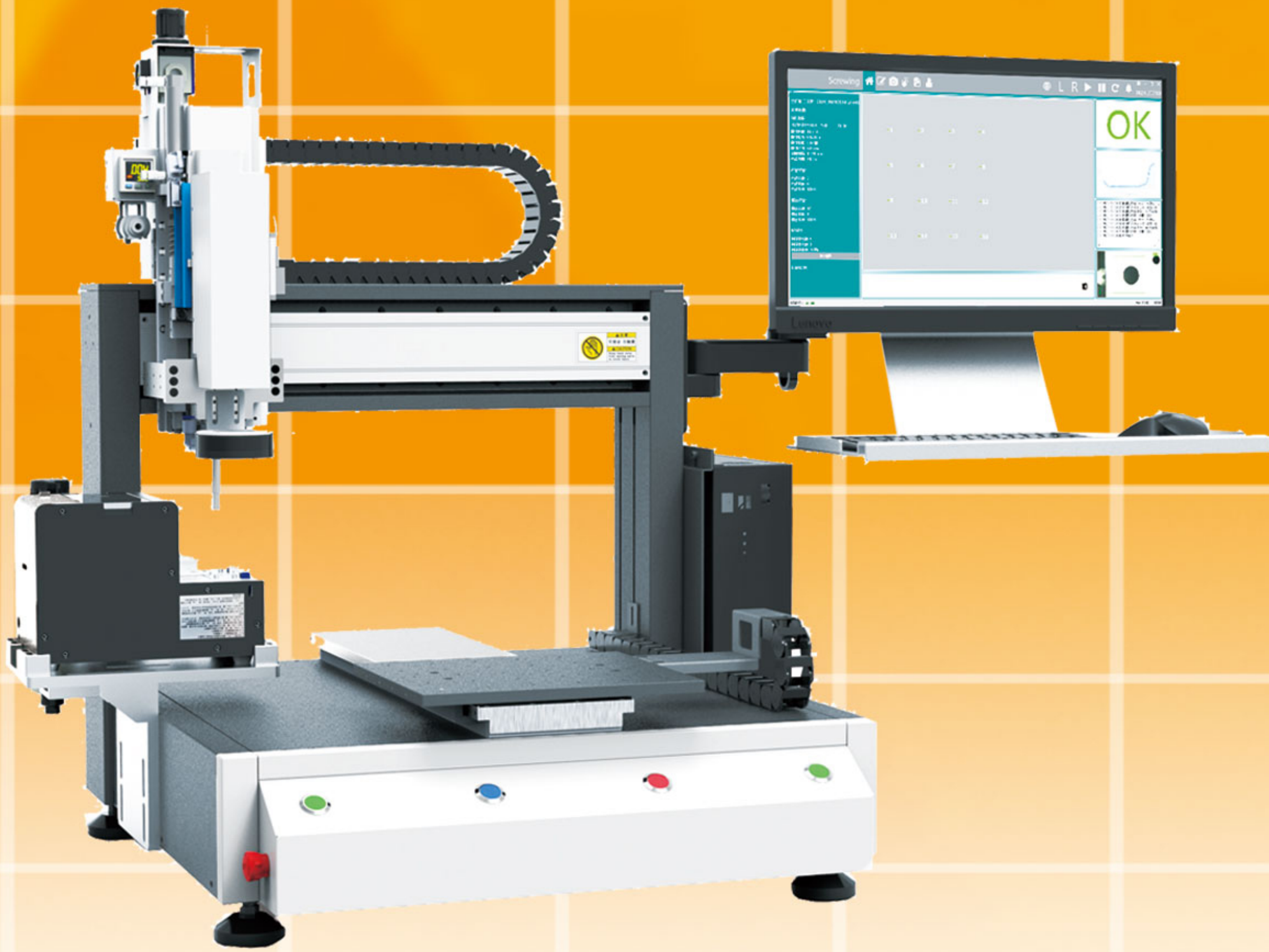
ET-7483K-P1(單 Y 軸)