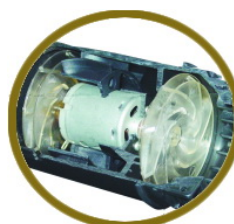
雙渦流旋轉風出風柔和