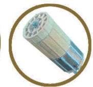
高精度發熱器溫度傳感器