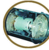
雙渦流旋轉風出風柔和