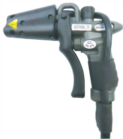
445F 高效能靜電消除槍